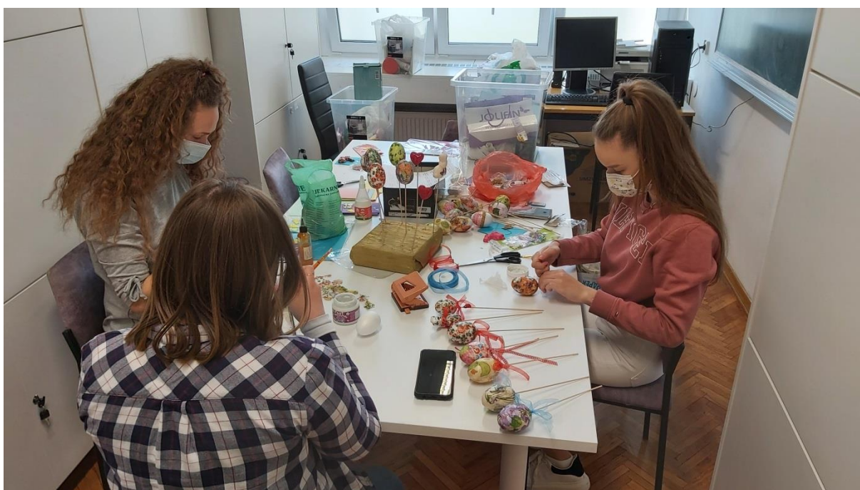
Izrada uskršnjih pisanica i čestitki