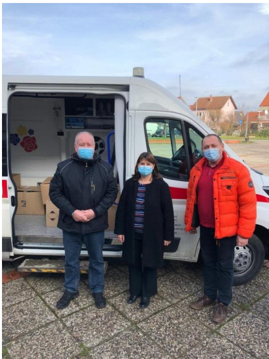
Predaja donacije djelatnicima Bolnice