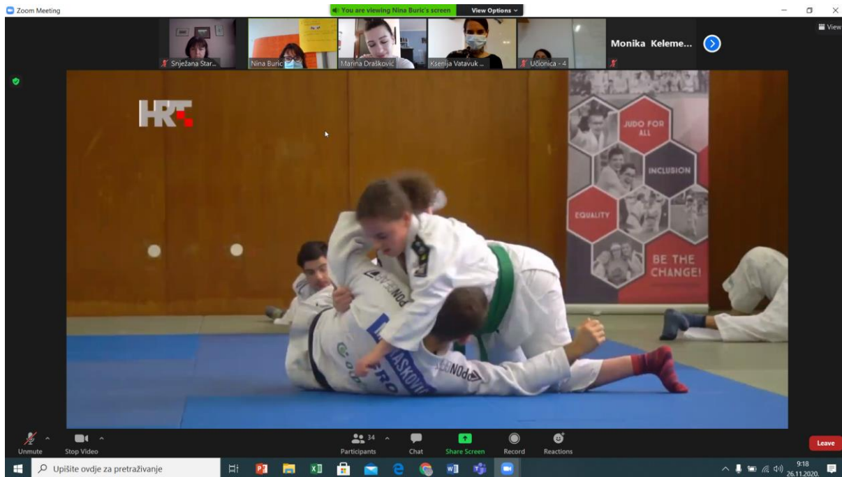
Prikazivanje filma o Fuji klubu tijekom tribine.