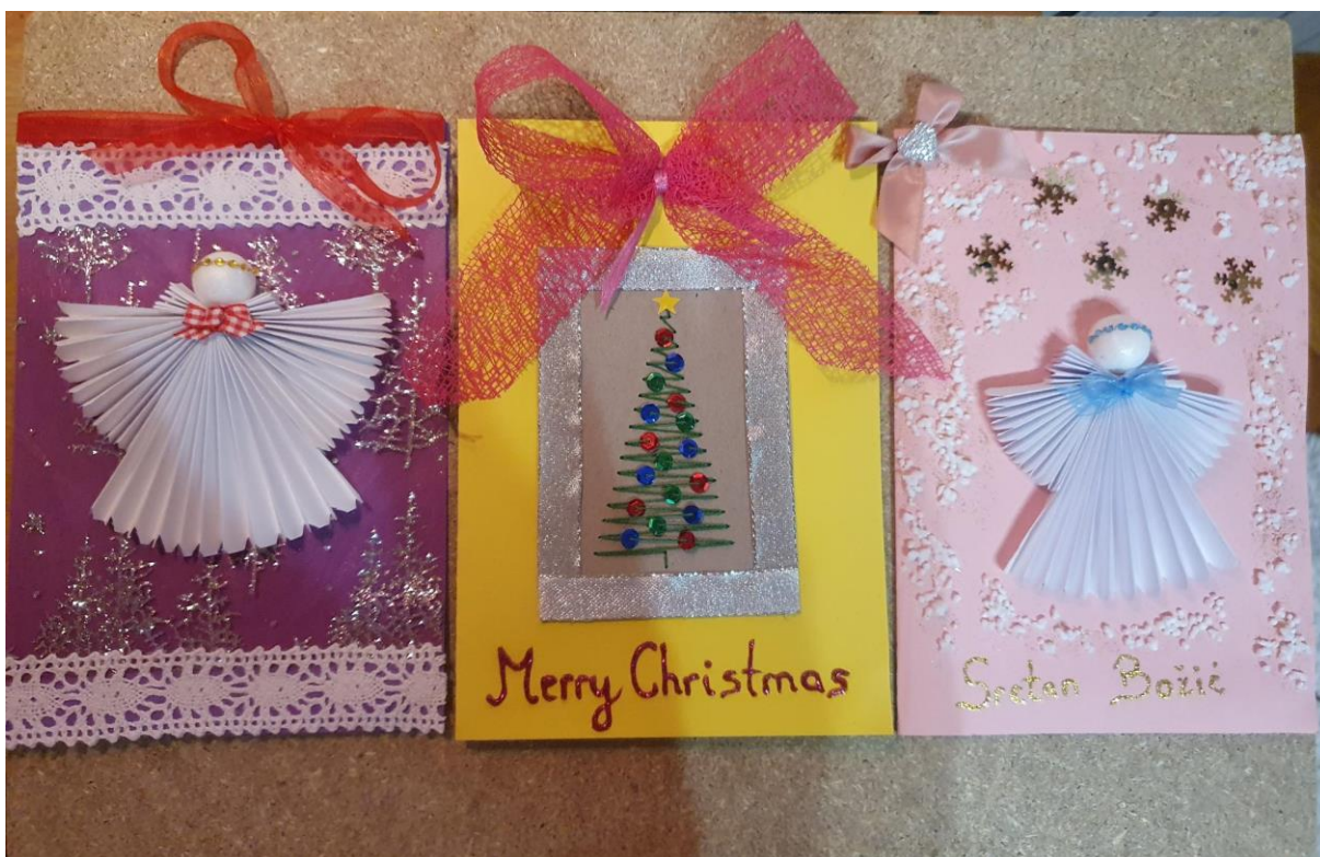
Priprema božićnog ukrasa i čestitki za štićenike u Domu za starije „Noni“