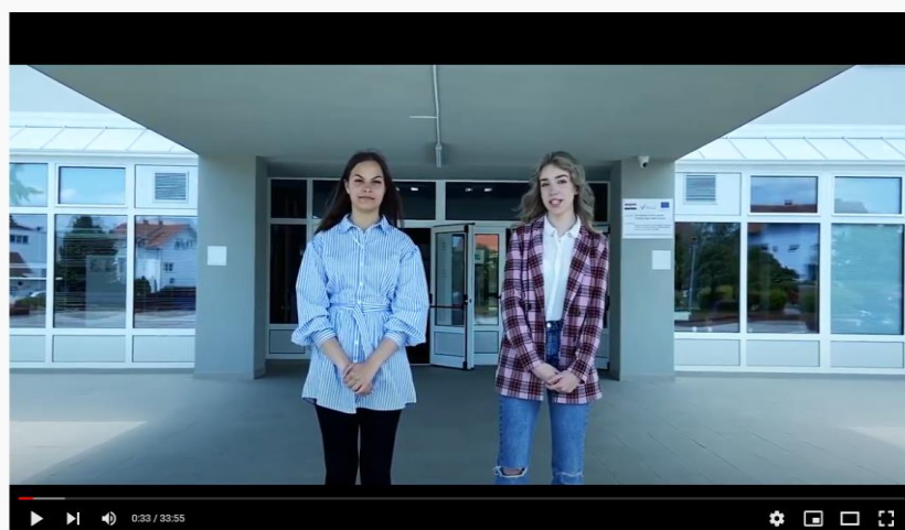
Ekonomska škola Velika Gorica - 30 godina škole

Video uradak je objavljen i na webu naše škole.